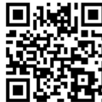
Facebook siden til POIKZ