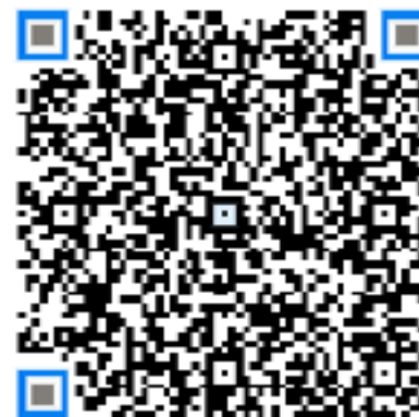
Facebook applikasjon for forhåndsbestilling